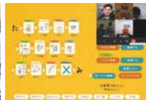
コロナ禍では、リモートでゲームを楽しむ