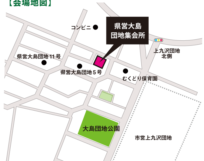
県営大島団地集会所（相模原市緑区大島4）